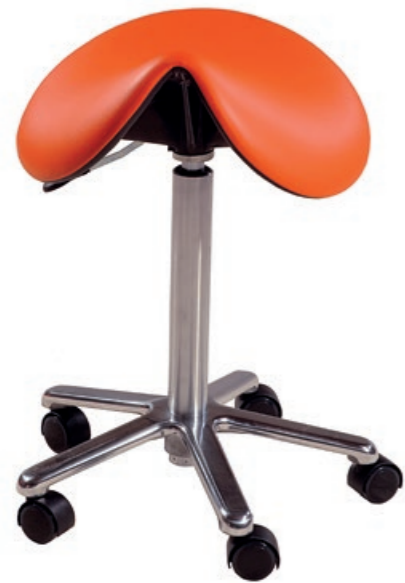
Tabouret NEO Pony