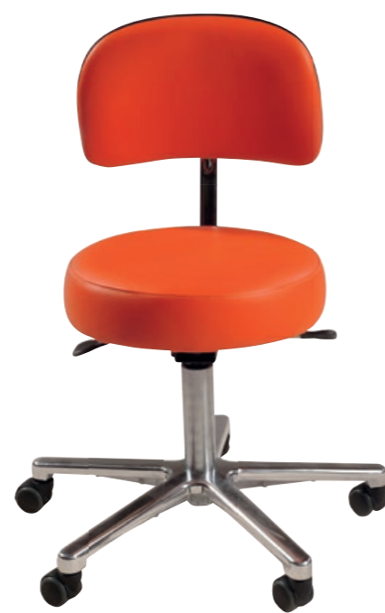
Tabouret NEO Classic