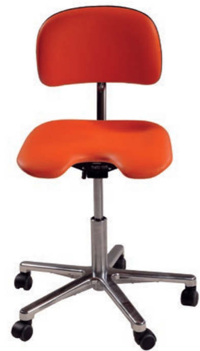
Tabouret NEO Dental