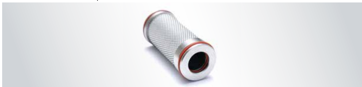
Filtre contre les bactéries et les virus pour le dessiccateur à membranes

Filtre contre les bactéries et les virus pour les systèmes d'air comprimé ULPA U16