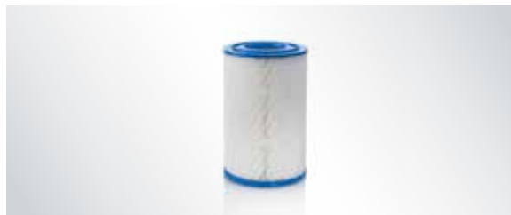
Filtre ologique de refoulement de l'air contre les bactéries et les virus pour V/VS 600 - V/VS 1200 S, V 2400, Tyscor V/VS, PTS 200 et systèmes d'aspiration pour cliniques V 6000, V 9000, V 12000, V 15000 et V 18000