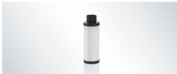
Filtre de refoulement de l'air contre les bactéries et les virus pour VS 250 S, V/VS/VSA 300 S, Variosuc et PTS 120

Filtre de refoulement de l'air contre les bactéries et les virus pour les systèmes d'aspiration HEPA H14