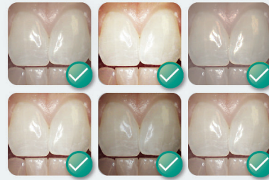
Schéma de teintes intelligent

BRDF : distribution bidirectionnelle de la réflectance