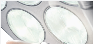
Mode lumière neutre

Vous pourrez compter sur le scialytique KaVo pour être votre partenaire tout au long de la longue vie des équipements KaVo grâce aux composants de premier choix qui le composent.